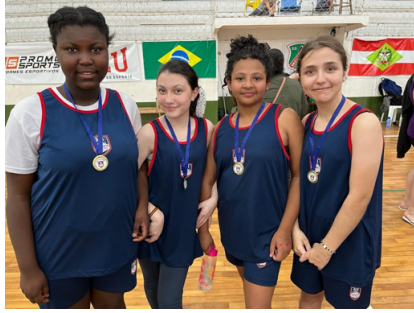
Evento de integração pais e alunas.